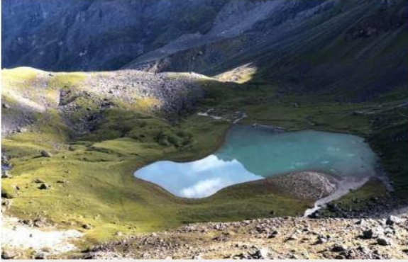
दुधकुण्ड रसुवा जिल्लास्थित धार्मिक स्थल दुधकुण्ड