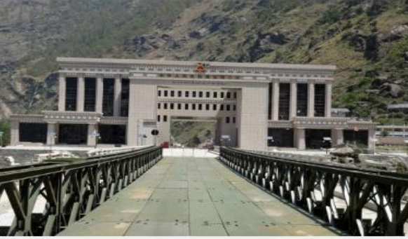
रसुवागढी नाका रसुवागढी स्थित चीन प्रवेश नाका